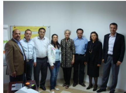
Equipe des formateurs ACC et Expert ITC

Les outils pédagogiques sont développés par ITC, et utilisés exclusivement par le réseau de franchisés.